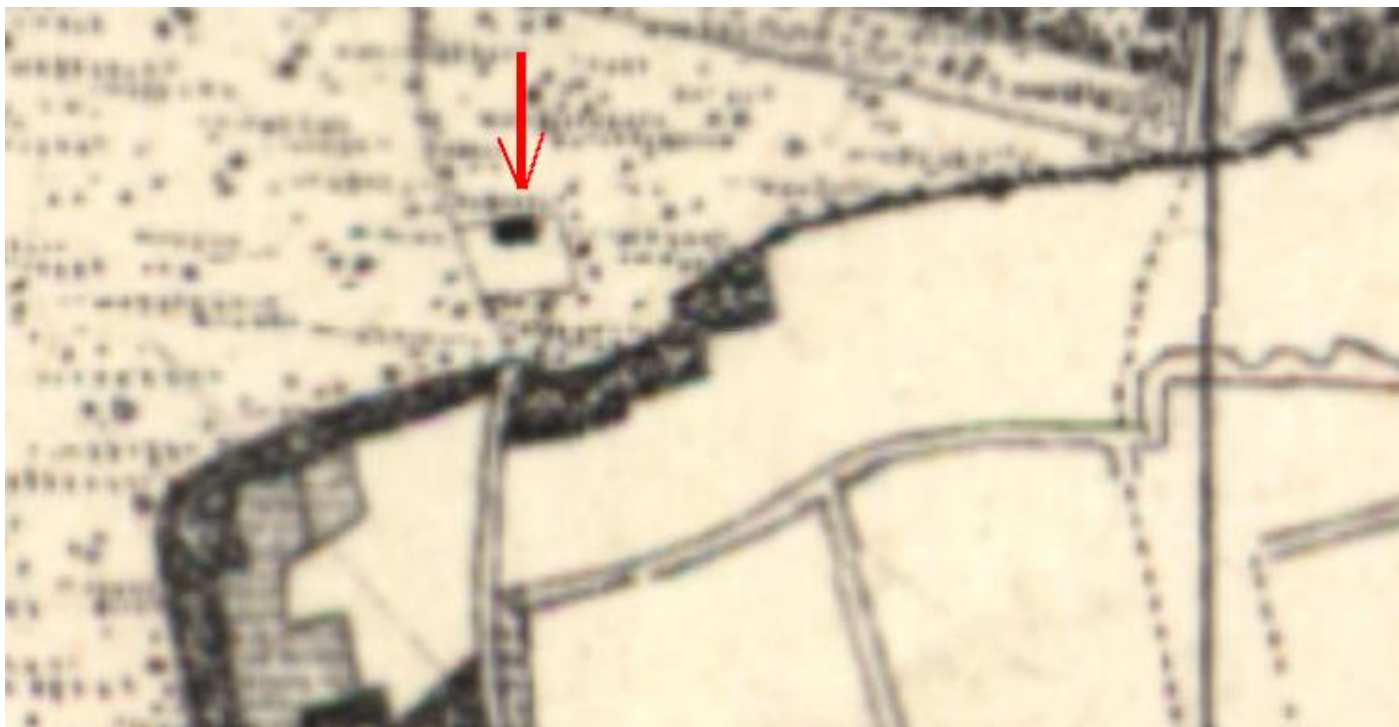
Kaart van 1865. Het perceel is nu beter afgebakend. De donkere vlekken eronder zijn de Tungeler Wallen, die vroeger nog verder doorliepen. Een gedeelte van de Tungeler Wallen aldaar is afgegraven tbv landbouwgrond. Het huisje lag dus erg beschermt.