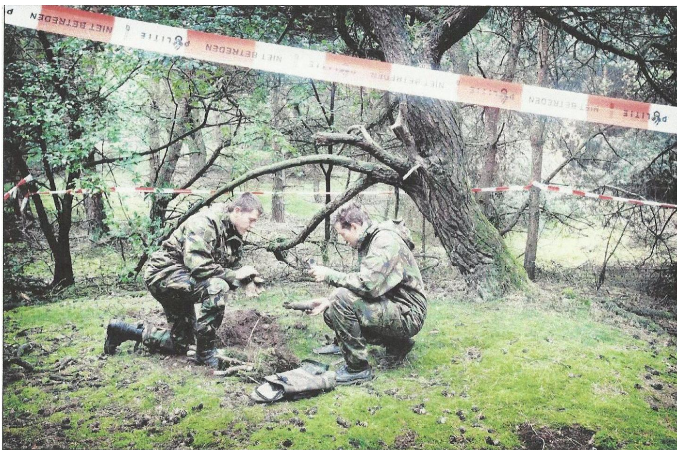
Medewerkers van de explosieven opruimingsdienst (EOD) bekijken de granaat die even later wordt opgeblazen.

‘Gelukkig gaat het niet om zijn grote broertje’