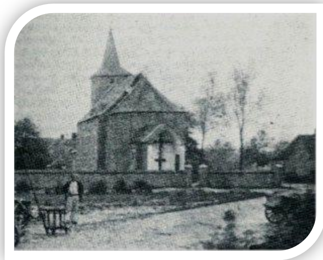
de nieuwe kerk zoal die gebouwd werd vanaf 1792