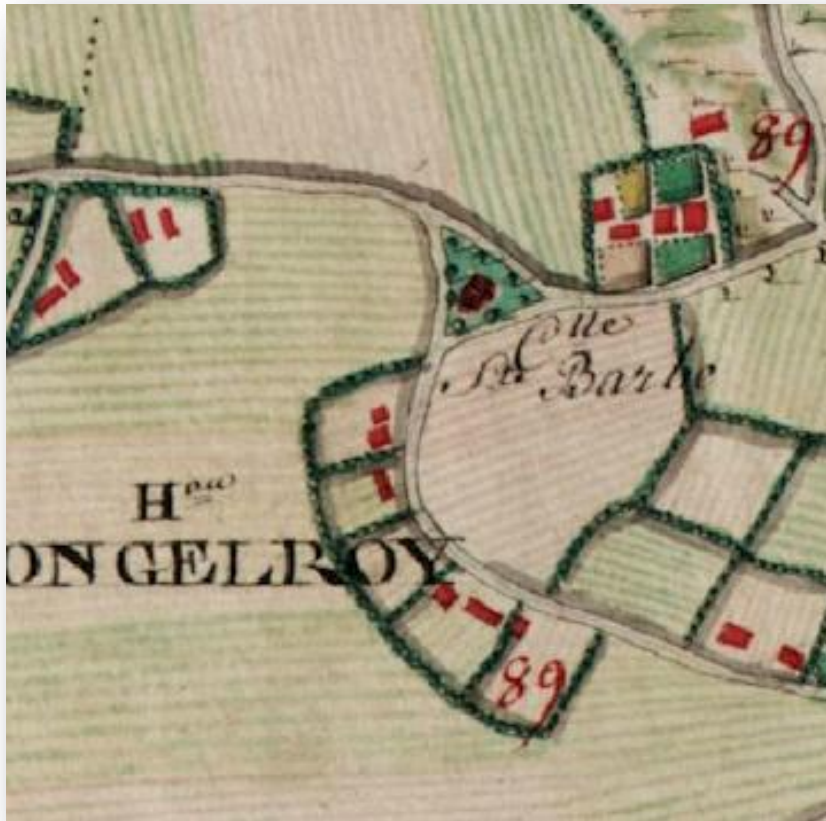
Kaarts van 1771 mét Kapel St. Barbara

aan deze kapel waren de zijmueren van mergelsteen, de voorste muer en de sakristeij van gebacken steenen; deze steenen hebben zij gebruickt aen de nieuwe kerk voor de fondamenten in den grond. De oude kapel hebben zij beginnen af te breken in het jaer 1792, den 24 October; de nieuwe kerck hebben zij beginnen te bouwen datzelfde jaer 1792, den 31 October, op welken dag de eerste steen geleijt is door den pastoor van Weert, ten twee uren na den noen. De plaets, waar de eerste steen geleijt is aen de kerck, is langs de Deijkerstraet op den hoek, daer het koor ingetrokken is onder den zesden balk van den toren te beginnen, geleijck boven aen de ankers te zien is.