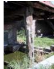
Hennenhof Swartbroek, gesloopt