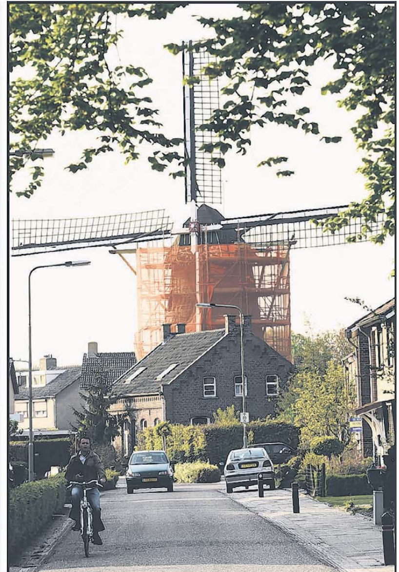
De St. Annamolen in Tungelroy en molen De Nijverheid in Stramproy staan sinds deze week helemaal in de steigers.